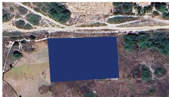
Planta Situação / sem escala